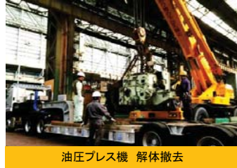
油圧プレス機 解体撤去