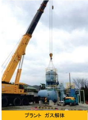
プラント ガス解体