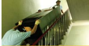
電動階段運搬機による搬出