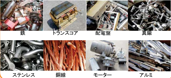
鉄 トランスコア 配電盤 真鍮 ステンレス 銅線 モーター アルミ

古物商・金属くず商 廃棄物再生事業者 ギロチンシャー シュレッダー ラバウンティシャー カタンシャー 三方プレス 新断プレス