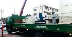
トラッククレーンでの引取作業