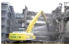
鉄筋コンクリート造解体

特定建設業 国土交通大臣許可(特-27)第26099号 一級建築施工管理技士 1名 一級土木施工管理技士 9名 二級土木施工管理技士 1名 二級土木施工管理技士 4名 解体工事施工技士 12名