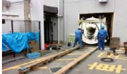
ウォールソー壁面切断・MRI搬出