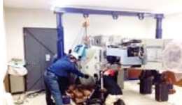
リニアック解体搬出